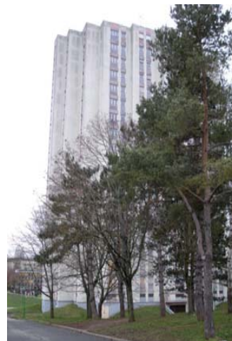
Une des tours prochainement démolie

Le projet prévoit aussi le réaménagement des abords des équipements publics, de manière à valoriser ces équipements, peu visibles aujourd'hui. Une esplanade piétonne reliera les nouveaux parvis des principaux équipements publics du quartier (bibliothèque, centre social...). Ainsi, l'entrée de l'école située en cœur de quartier sera modifiée, pour ne plus déboucher sur la rue mais sur le nouveau parc.