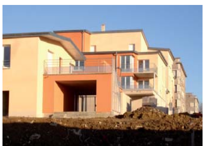
De petits immeubles collectifs qui s'intègrent à la pente.