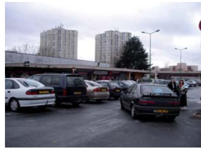
La place actuelle

L'espace de stationnement situé au cœur du quartier sera réaménagé en place publique. Ce lieu est conçu pour que le plus grand marché du département puisse y prendre ses aises. Un travail soigné sur les ambiances et l'aspect de la place en fera un lieu convivial : éclairage, mobilier urbain, utilisation d'anciens éléments de fonderie pour matérialiser les emplacements des étals du marché. Ce nouvel espace public sera encadré par des bâtiments de trois étages qui abriteront des logements et des commerces en rez-de-chaussée.