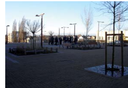
La place de l'école, en fin d'après-midi, aménagée avec des pavés autobloquants, des bancs, et des jeux pour enfants.

Le contexte urbain et social difficile a conduit au choix de démolir toutes les grandes « barres », qui comptaient de nombreux logements vacants. De nouvelles rues et plusieurs espaces publics ont ainsi pu être créés, et la vue retrouvée vers le sud permet de profiter du paysage. Les bailleurs sociaux ont privilégié la reconstruction de petits immeubles collectifs et de maisons mitoyennes. Ces nouveaux logements sont notamment attribués aux locataires des immeubles démolis.