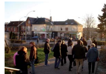
Au terme de la promenade, une place et ses commerces de proximité.