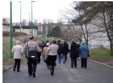
L'emplacement de la nouvelle voie

A proximité de la place du marché, un parc sera créé à l'emplacement de deux tours, prochainement démolies. Il a vocation à être le poumon vert du quartier.