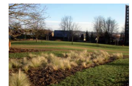
La Maison des projets de La Houillère se situe dans le nouveau parc ouvert au public, où se trouve un bassin.