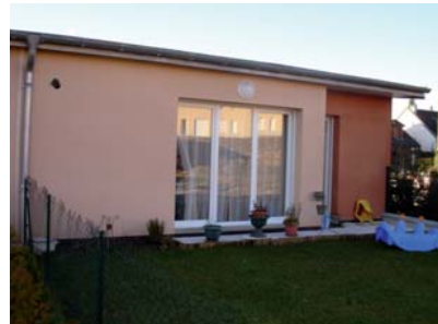
Des maisons individuelles accolées avec, à l'arrière, leur jardin.