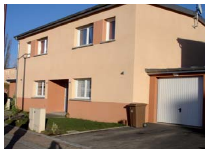
Des maisons mitoyennes, avec garage atenant.