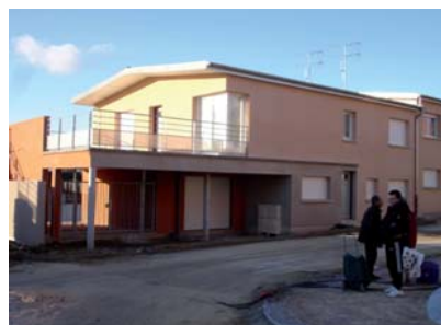
Au rez-de-chaussée, un premier logement avec jardin et garage. A l'étage, un second logement avec un emplacement sous le auvent pour stationner et une terrasse.